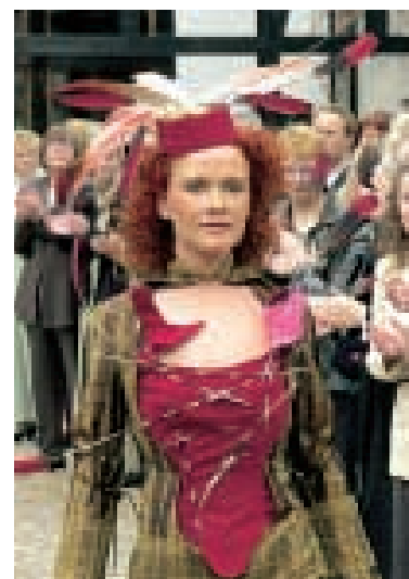
Für das „Afrika-Kleid“ wurden echte Stachelschweinborsten gesucht.