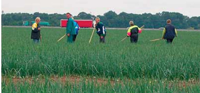
Die Zwiebelhack-Brigade in Aktion ...

gut für das Äußere ist – die Zwiebeln sind goldgelb. Die geringere Größe hat auch auf die Qualität keinen Einfluss. Im Gegenteil: Geschmack und Würze können dadurch sogar noch verstärkt werden. Zudem ziehen viele Verbraucher kleinere Zwiebeln den größeren vor, weil sie sich besser verwerten lassen und am Küchentisch nichts übrig bleibt. Das beweist auch die Tat-