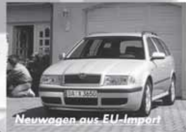
Neuwagen aus EU-Import

40 KW, ZV, Klima, 4 Türen, Servolenkung, el. FH 11.900,- EUR