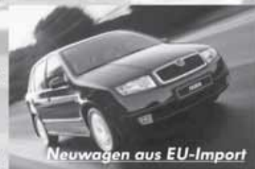
Neuwagen aus EU-Import