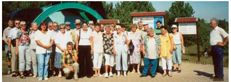
Die gesamte Gruppe am Mondsee.