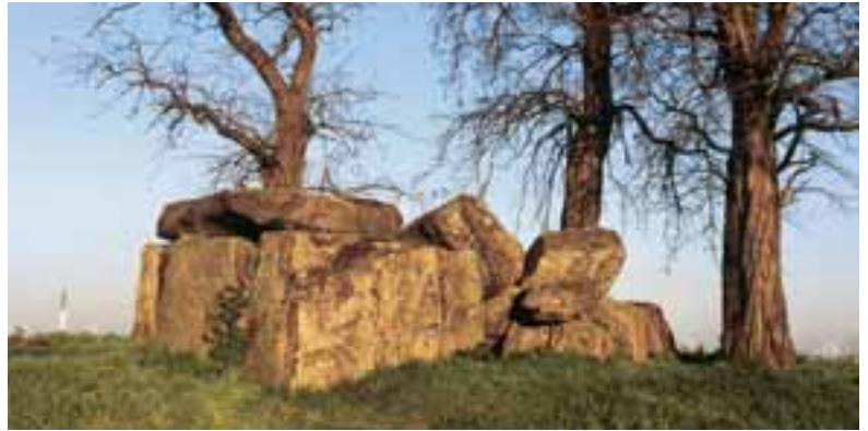
Das Steinzeitgrab von Gerbitz