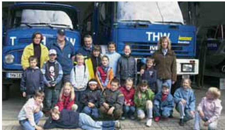
Die Kinder des Lessing-Hortes besuchten das THW Calbe.

sprungwasser „dreckiger als das einer Pfütze war“. Für die Besucher ein Aha-Erlebnis, weil bei uns bekanntermaßen Trinkwasser im Überfluss da ist und sich bis dahin niemand vorstellen konnte, es aus „Pfüthenwasser“ zu machen.