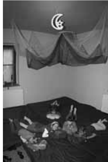
Schöne Träume im Snoezel-Raum.

Calbe. Auch die städtische Kindertagesstätte „Haus Sonnenschein“ besitzt jetzt einen so genannten Snoezel-Raum. Darin können sich die Kinder in ruhiger Atmosphäre und bei leiser Musik entspannen. Räume dieser Art sollen Rückzugsgebiete im Tagestrubel sein, wohin sich die Kinder zurück ziehen können.