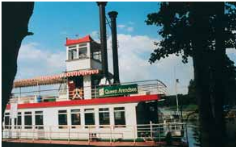
Die „Queen Arendsee“ in der Abendsonne