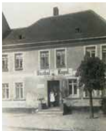
„Goldene Kugel“ um 1934