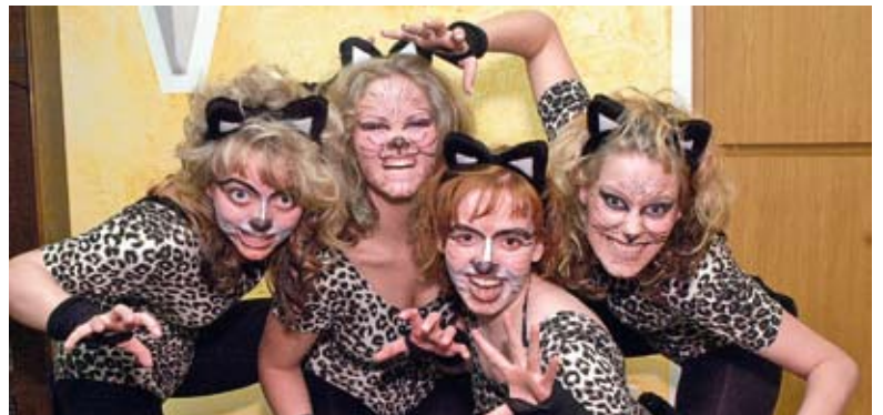
Auf solche reizenden Bilder müssen die Calbenser verzichten, weil Fasching an der Saale offenbar kein Thema ist.

die Veranstalter aufgegeben. Warum das so ist, wissen die Götter. Dabei würden sich die Büttendredner ihre Hände reiben bis es qualmt, bei dem, was in Calbe alles so geschieht. Bärenbolle und Bismarckturm, Stahlschnittmodelle und Hundepullerstein, Eulenspiegeldenkmal und Holzblockhaus, Trinkergemeinschaft und geklaute Wartenberg-Enten und, und, und ... Zudem würde auch der Stadtrat für so manche kommunale Eulenspiegelei gute Vorlagen liefern. Doch was solls. Das Wort Fasching kommt übrigens von Vaschanc, was den Ausschank des Fastentrunks bezeichnete. Der Begriff Karneval ist nicht eindeutig geklärt. Herleitungen weisen auf das mittelalterliche carnevale, die mit der Fastenzeit bevorstehende „Fleischwegnahme“, hin. Im 19. Jahrhundert wurde der Begriff auch auf das römische,