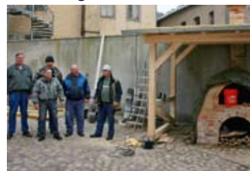
Die Montagebrigade zum Fototermin

Dem Ingenieurbüro Sehmisch/Sieche und der Teutloff Calbe, insbesondere den genannten 5 Kollegen, sei nochmals herzlich für ihre Bemühungen gedankt. Wieder konnte eine Hürde bei der Umgestaltung des Hofes Markt 13 genommen werden. ■