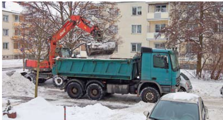
Ein seltenes Schauspiel gab es Mitte Januar auf Calbes Straßen zu sehen. Der Schnee wurde an einigen Orten mit schwerem Gerät verladen und abtransportiert.

Viele Calbenser fragen sich, wann es denn schon einmal so einen strengen Winter gegeben hat? Aus älteren Quellen stehen da zunächst einmal die Winter 1939/40 und 1940/41 mit sehr viel Schnee an. Einige alte Calbenser erinnern sich noch daran, dass im Januar 1940 in der Schloßstraße der Schnee bis an die Festersimse geschippt war. Nach dem Kriege sticht besonders der Übergang von 1946 zu 1947 hervor. Auch in den 1950er Jahren hatten wir strenge Winter. In diesen Jahren war die Saale oftmals zugefroren, so dass man von der Saalemauer zum Möchsheger zu Fuß, mit Schlittschuhen, oder sogar mit dem Fahrrad gelangen konnte. Auch der Winter 1962/63 hatte es in sich. Gut in Erinnerung ist der Jahreswechsel 1978/79, der gewisse Ähnlichkeiten mit dem derzeitigen Winter hat. Am Silvesterabend 1978 begann es zu schneien. Durch weitere Schneefälle und strengen Frost wurde eine extreme Kälteperiode eingeleitet. Zu dieser Zeit kam die Versorgung mit Braunkohle und somit die Stromerzeugung der DDR fast zum Erliegen. In Calbe hatten wir es besser, da das Kraftwerk auf dem Gelände des MLK mit Erdgas betrieben wurde, waren Strom und Fernwärme gesichert. Im Januar 1996 kam es zu einer Frostperiode mit minus 21 °C. Viele Beispiele für Wintereinbrüche ließen sich anführen. Doch wir wurden in den letzten Jahren und Jahrzehnten oftmals mit milden Temperaturen verwöhnt. Es wurde immer milder, leichte Frostperioden, Tauwetter, Schneefälle