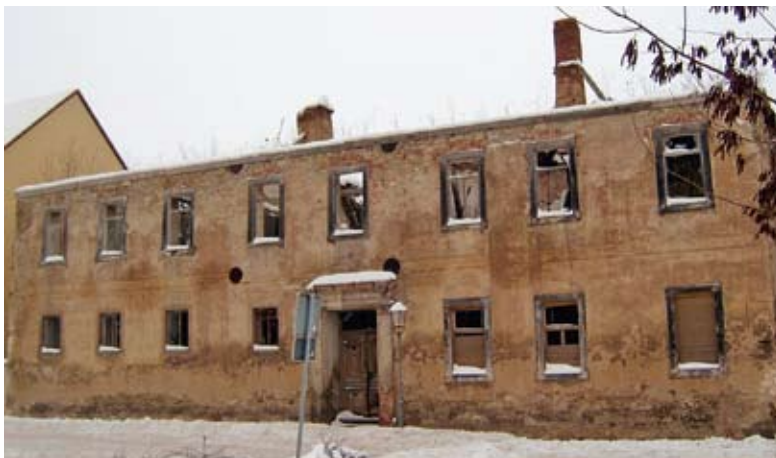
Ritterstrasse 1- ein Dilemma

Die im Linßner-Artikel erwähnte „Wrangel-Kapelle“ lässt sich nicht eindeutig auf das Wirken der Wrangelfamilie zurückführen und das Geburtshaus von Anna Magareta, das Haus „Ritterstraße 1“, ist in einem erbärmlichen Zustand. Da ist guter Rat teuer, denn ohne die erwarteten Sehenswürdigkeiten dürfte sich die Sache von selbst erledigt haben. Vielleicht sollte man unter diesem Aspekt nochmals Kontakt mit der Erbgemeinschaft „Ritterstraße 1“ aufnehmen. ■