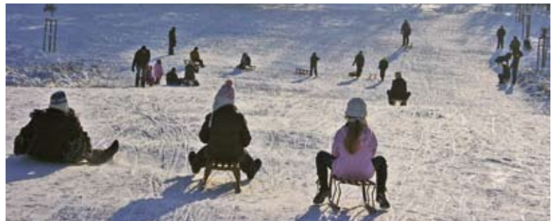
Hochbetrieb in der Grünen Lunge

Gern erinnert man sich beim Spaziergang in diesen Regionen an die eigene Jugend, als es noch Schnee in Hülle und Fülle gab. So ist das halt beim Älterwerden. ■