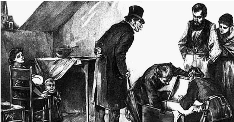
„Hausdurchsuchung“ Unterschrift: Hausdurchsuchung nach verbotenen Schriften in einer Arbeiterwohnung (Zeitgenössischer Stich)