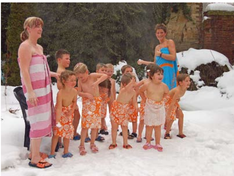
Die Kinder der Elefantengruppe kühlten sich nach ihrem Saunabesuch im Schnee ab.

Calbe. Viola Rätzel, die Leiterin des Kindergartens Haus Sonnenschein, führt alle 14 Tage eine Kindergruppe ihrer Einrichtung in die Sauna am Lorenz von Olaf Schmidt. Dieses Programm der Kindersauna findet im Wechsel mit dem Haus des Kindes von September bis Juni statt. Viola Rätzel ist davon überzeugt, dass sich das auf die Gesundheit und Widerstandskraft der Kinder auswirkt. Sie kann sich da ein Urteil bilden denn sie geht mit ihren Schützlingen bereits viele Jahre dorthin. Grundlage für die Saunaeignung ist allerdings eine ärztliche Untersuchung.