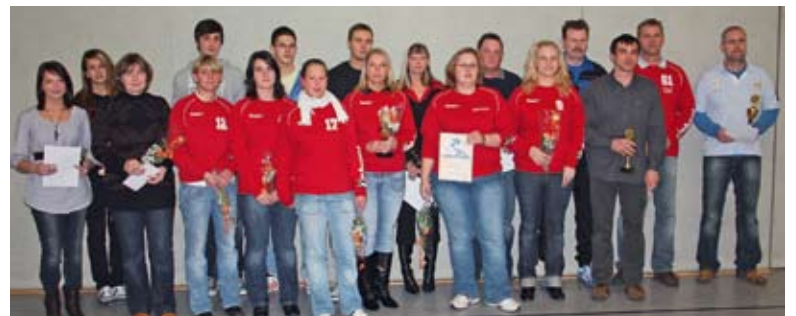
Nach der Sportlerehrung für die Handballer 2009 nahmen alle Ausgezeichneten für ein Gruppenfoto Aufstellung.

begehrten Medaillen und Überraschungspakete in Empfang nehmen.