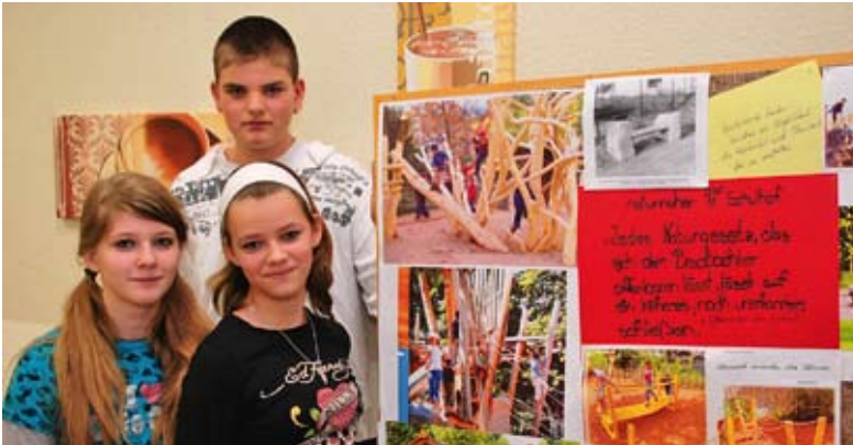
Jugendliche der Barbyer Friesschule machten sich Gedanken über die Schulhofmodernisierung.