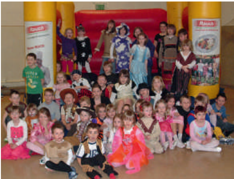
52 Kinder erlebten kürzlich eine tollen Nachmittag beim Kinderfasching der TSG-Handballer in der Sporthalle Zuckerfabrik.

Mai um 17.00 Uhr gegen den SV Langenweddingen und am 21. Mai um 17.00 Uhr gegen den HSV Haldensleben. Die 1. Frauen bestreiten ihre letzte Partie am 14. Mai um 17.00 Uhr gegen den HBV Jena. ■