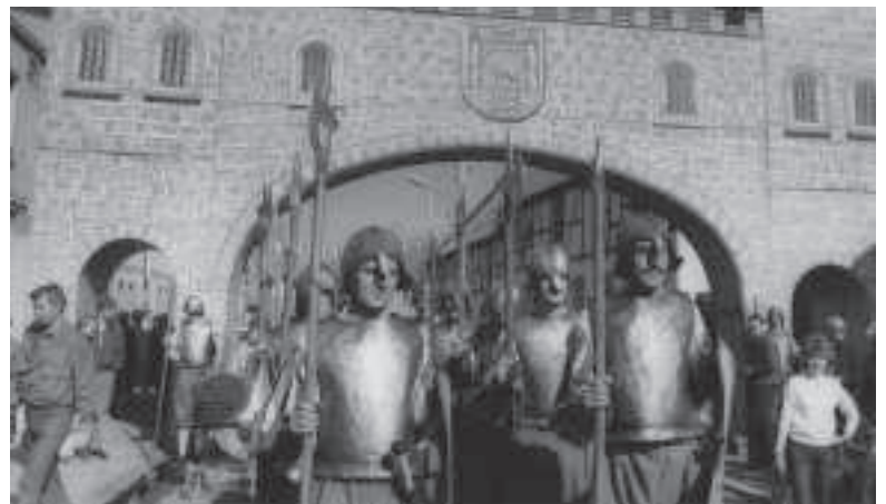
Zur 1025-Jahrfeier liehen sich die Barbyer 1986 ein Stadttor aus Calbe aus. Es wurde damals zur saalestädtischen 1050-Jahrfeier aufgestellt, die im selben Jahr stattfand.

das Wasser durchqueren. Solange wie das geschah, konnten sich die Verteidiger formieren. Ob es zu spektakulären Kriegshandlungen kam, ist geschichtlich nicht verbürgt. Wohl hat es kleinere Auseinandersetzungen vor und hinter der Mauer gegeben, aber offensichtlich keine schweren Kampfhandlungen. Die fünf Stadttore werden von Konrektor Conradi in der ersten Hälfte des 19. Jahrhunderts erwähnt. In seiner Chronik heißt es: „Gegen Osten führt das Brücktor, ein in der Mauer befindlicher mit zwei starken Torflügeln nebst Pforte versehener Spitzbogen, mittels einer unmittelbar daran befindlichen hölzernen Brücke