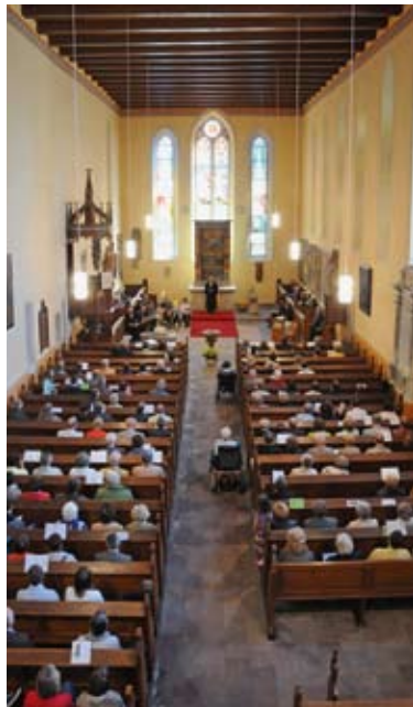
Die Johanniskirche wurde Anfang Mai wieder ihrer Bestimmung übergeben.