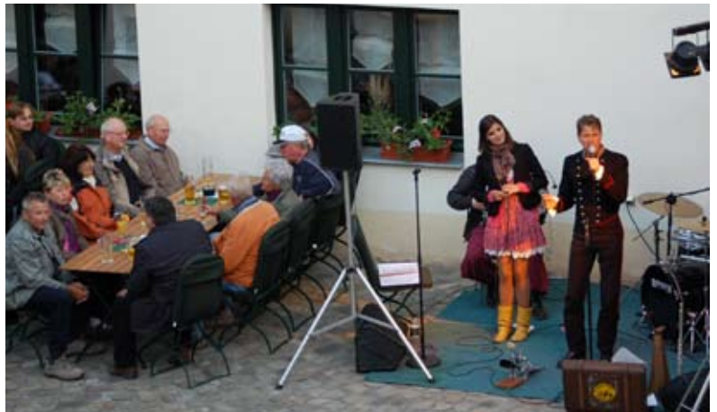
Die Musik ganz nah am Publikum.

Erfreulicherweise waren rund 100 Gäste der Einladung gefolgt. Alles im allem eine gelungene, wenn man so will, Walpurgisveranstaltung. Eine Folgeveranstaltung 2012 wird es auf jeden Fall geben, bis dahin wird sich das Hofambiente noch weiter entwickelt haben. Gedacht ist an eine Begrünung und Dekoration. Also schauen Sie ruhig immer mal wieder rein. So zum Beispiel zum Rolandfest 2011. ■