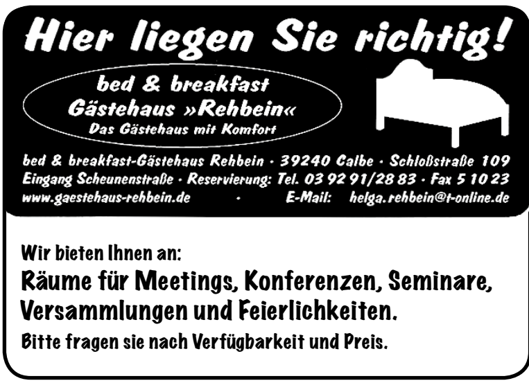
Text und Foto Uwe Klamm