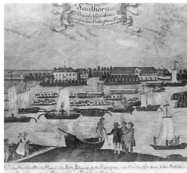
Stich des Meißner Hofmalers Hans Carl von Sauer, 18. Jhd. (Kopie), (im Druck: K. von Sauer, 18. Jhd.)

Als der Salzhandel drastisch zurückging, wurde die Salzniederlage aufgelöst und das große Salzmagazin 1845 nach Halle umgesetzt, wo es in seiner Grundsubstanz bis heute erhalten blieb. Wenn es nun in naher Zukunft hier restauriert sein wird, haben auch die Menschen von der Saalemündung ein Stück ihrer Geschichte wiederbekommen. ■