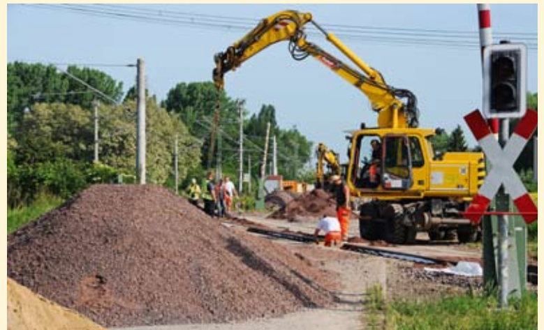
Gleisumbau in Vorbereitung der neuen Bahnstrecke Calbe (Stadt).

Nun muss noch eine Verbindung zur Strecke Magdeburg/Halle geschaffen werden. Die Planung sieht sozusagen eine „Verbindungskurve zur Verbindungskurve“ vor. Soll heißen: Vom Gleis der Strecke Calbe (West)-Barby wird eine Kurve zur jetzt sanierten Verbindungskurve am Abzweig Seehof gebaut. Die Gesamtkosten von 13,9 Millionen Euro tragen