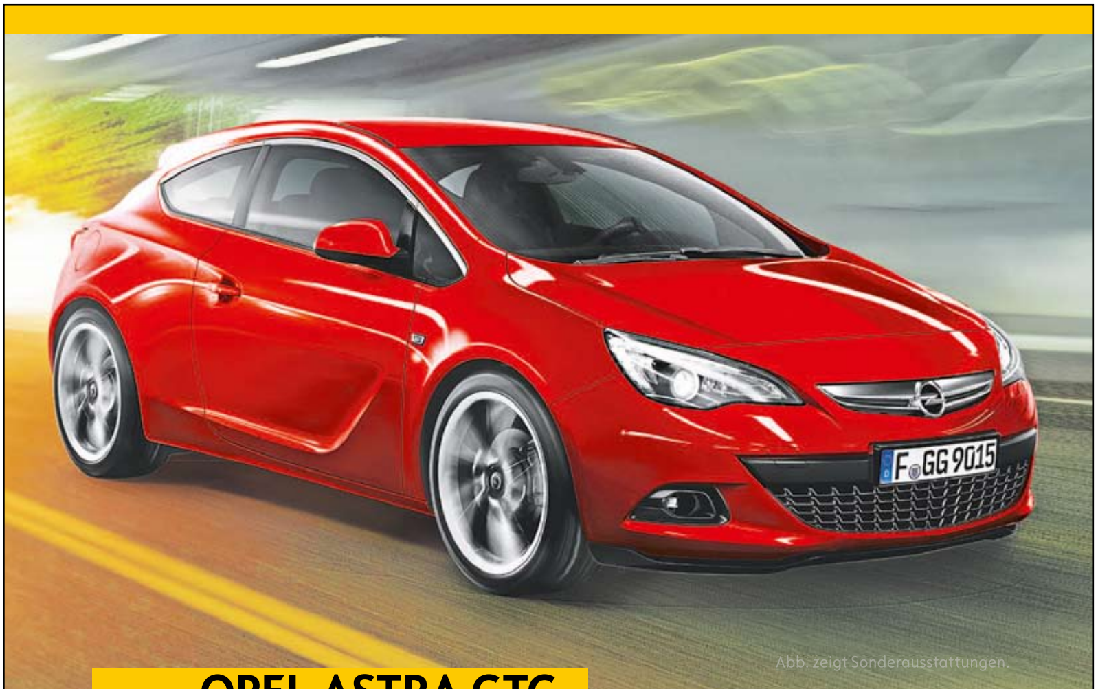
Abb. zeigt Sonderausstattungen.