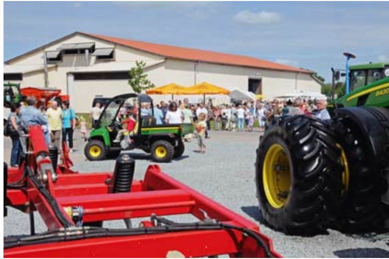
Rund 2000 Leute kamen zum großen Hoffest der Calbenser Agrar GmbH, die ihr 20-jähriges Bestehen feierte.

Hier hatte die Firma ein Fest organisiert, das die Massen bei allerschönstem Frühsommerwetter begeisterte. Ein Hubschrauber startete zu Rundflügen, der Brumbyer Kindergarten sang, die schwarzledernen Damen und Herren des „Sax´n Anhalt Orchesters“ sorgten im wahrsten Sinne für einen bewegten Sound auf dem Hofgelände. Dort präsentierten sich zahlreiche landwirtschaftliche Erzeuger oder ehrenamtliche Gemeinschaften wie die Feuerwehr Glöthe mit alter und neuer Technik oder ein Schützenverein, der zum Adlerschießen einlud. Natürlich drehte sich viel um die Zwiebel. Der Calbenser Bollenköniginnenverein verbreitete den Duft gebratener Zwiebeln; zwei Majestäten lustwandelten huldvoll unterm Volk.