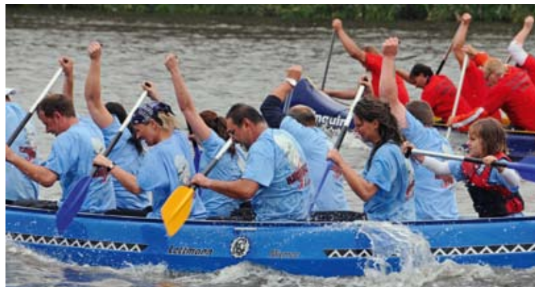
„Das Hausboot“ hieß so, weil sich eine Hausgemeinschaft zusammengefunden hatte.

Sieger bei den Frauen wurden die „Bornschen Söckchen“, in der Kategorie Mix der „Ananas-Express“ und bei den Männern gewannen die „Möwenwinker“. ■