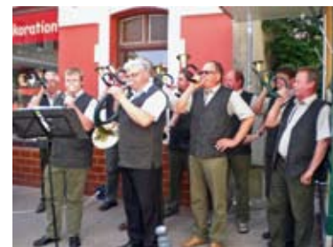
Gäste und Zuhörer sind gern gesehen. Für das leibliche Wohl wird gesorgt.

Eingeladen sind mehrere Jagdhornbläsergruppen, die verschiedene Stücke vortragen werden.