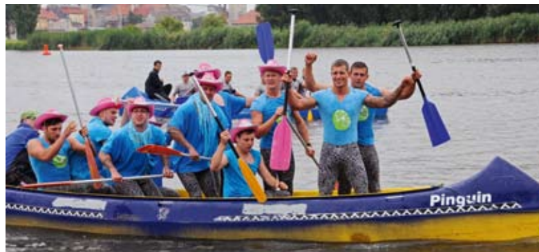
Schräg: Die Herren von „Hörnchens Clan“ trugen zum rosa Hut knallgelbe Leggings.