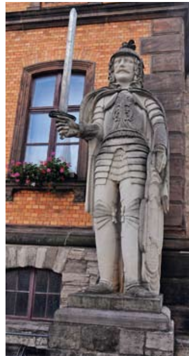
Der neue Calbenser Roland steht seit 35 Jahren auf seinem Sockel.

1974 beauftragte der damalige Rat der Stadt Calbe den Nossener Bildhauer Eberhard Glöss, aus Cottaer Sandstein (Elbsandsteingebirge) einen neuen Roland zu schaffen. Eine kleineres Gipsmodell ist in der Heimatstube zu sehen. Die 4,50 Meter große Statue ersetzt einen hölzernen Vorgänger, der aus dem Jahre 1656 stammte. Er war nach dem Krieg bis auf den Schild vollständig abhanden gekommen. Die Calbenser sind stolz auf ihren „Hüter der Marktgerechtigkeit“ und werben mit ihm im Netzwerk deutscher Rolandstädte. Man verspricht sich davon, touristisch interessanter zu werden. ■