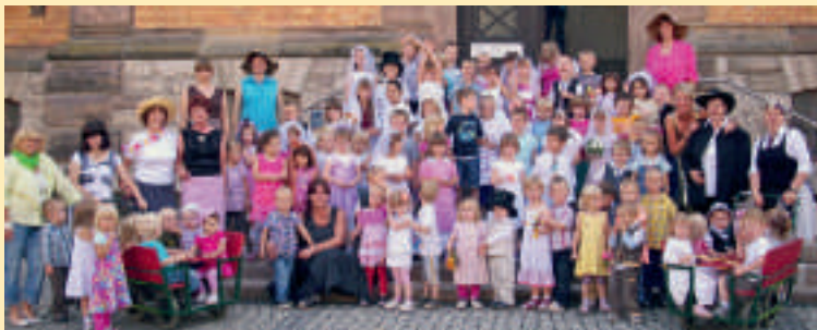
Eine besondere Hochzeitsgesellschaft auf der Rathausstuppe.

Calbe. In der Sommerzeit ist der AWO-Kindergarten „Haus des Kindes“ immer mittwochs für größere Veranstaltungen reserviert.