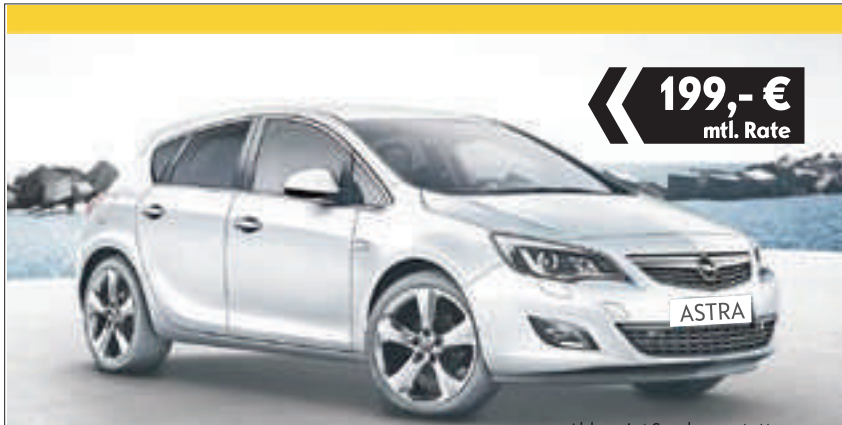
Abb. zeigt Sonderausstattung.