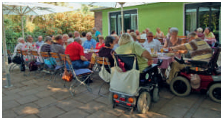
Zum Grillfest in der Grünen Lunge trafen sich die Mitglieder des Behindertenverbandes Calbe.

Zu einem moderaten Preis wurde dann noch für jeden eine Grillplatte gereicht, die dann auch Genuss pur brachte. Danach machten natürlich die Neuigkeiten die Runde. ■