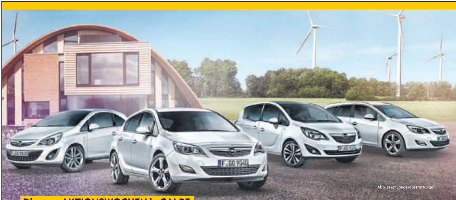
Abb. zeigt Sonderausstattungen.