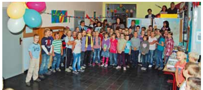
Musikalische Einstimmung am Morgen

Vom 04.10 – 07.10.2011 fand in der Grundschule „G.E. Lessing“ Calbe eine Festwoche zu den Jubiläen „50 Jahre Schulstandort“ und „20 Jahre Grundschulstandort“ statt. Dazu waren die Schule und das Außengelände festlich geschmückt. Rückschau. Am 18.11.1961 war dieser Schulneubau übergeben worden, eine zehnklassige Polytechnische Oberschule, die 1964 den Namen „Wilhelm Pieck“ erhielt. Mit der Wende wurde sie 1991 in Grund- und Sekundarschule „G. E. Lessing“ umbenannt. Im Jahre 2005 zog der Sekundarschulenteil aus dem Gebäude aus. Die 4 tol-