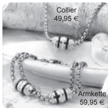
Collier 49,95 €