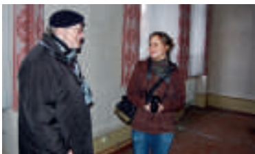
Auf Fotoexkursion im Markt 14

Calbe. Mit diesem Aufruf wendet sich der Heimatverein, stellvertretend, an einen bestimmten Personenkreis. Konkret geht es um Bürger, die in der Vergangenheit direkt mit dem Gebäude „Markt 14“ zu tun hatten. Also, die dort im Obergeschoß gewohnt haben oder Mitarbeiter des im Gebäude befindlichen Einwohnermeldeamtes oder in der dortigen Polizeistation tätig waren. Grund für dieses Anliegen ist das Interesse einer jungen Frau aus Schönebeck, die bei ihrem Masterstudium im Studiengang „Denkmalpflege“ eine Arbeit über dieses ehrwürdige Gebäude schreiben möchte. In Ihren Recherchen wendete sie sich an den Heimatverein,