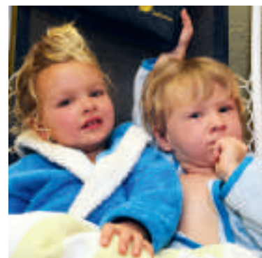
Diese zwei „Sonnenscheine“ relaxen nach dem Saunagang.

Andere Kindereinrichtungen setzen ebenfalls auf diese Form der Abhärtung.