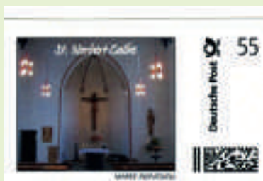
Die offizielle St. Norbert-Briefmarke

Die St. Norbertkirche ist nicht von ungefähr zum Motiv einer Briefmarke geworden. Im vergangenen Jahr wurde das katholische Gotteshaus für rund 70 000 Euro innen umfassend saniert und auch umgebaut. Von den Wänden wurden alle alten Farbanstriche gründ-