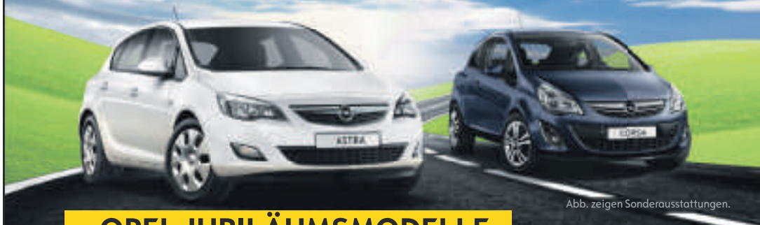
Abb. zeigen Sonderausstattungen.