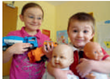
Jungs spielen am liebsten mit Puppenwagen und Mädchen

verkleiden sich gern als Indianer und spielen mit Autos oder andersherum? Ist doch Blödsinn! Jedes Kind kann und soll doch spielen, was und womit es möchte. Spielzeug nur für Jungs oder Mädchen gibt es nicht!