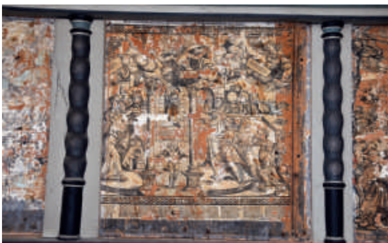
Die Reste der Einblatt-Holzschnitte in der Brumbyer Autobahnkirche.

Beim vorsichtigen Abnehmen der Leinwände von Heinrich Busch (1667) fand man darunter mehrere Holzschnittbilder. Es handelt sich um relativ großformatige Papierbögen, die auf das Holz aufgeleimt wurden. Zu sehen sind biblische Szenen.