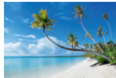
Ein Südseetraum: Die Cook-Inseln.

Telefon (07121) 696 696-0, www.treff-sprachreisen.de . ■