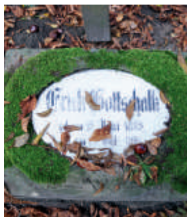
Grabstein aus dem 1. Weltkrieg.

Calbe. Seit Ende September 2012 wird die innere Friedhofsmauer saniert. Aufgrund der alten Bau- substanz traten immer wieder Schwierigkeiten auf. Es musste teilweise das Mauerwerk abge- stützt werden, so dass derzeit noch keine Aussage zum Bauende getroffen werden kann. Die Sol- datengräber für die Gefallenen des 1. und 2. Weltkrieges wurden in der Vergangenheit immer nur dürftig instand gesetzt. Jetzt werden sie mit Mitteln aus dem Kran- kenhauserlös umfangreich saniert und in einen ordentlichen Zu- stand versetzt. Ihnen widmet sich auch das Titelbild des „Calbenser Blatt“.