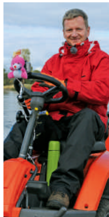
Plüschtier und Thermosflasche. Michael Kessler in Barby.

Barby. Der Schauspieler und Comedian Michael Kessler überquerte Anfang Oktober mit einem Elektrorasenmäher die Elbe bei Barby. Er war von Berlin zum Oberharz unterwegs. Das rbb-Fernsehen zeigt das vierteilige Reiseabenteuer ab 30. November: „Kesslers Expeditionen – Mit dem Rasenmäher auf den Brocken“ bis 21. Dezember in vier Teilen. Wie die Produktionsfirma betonte, gebe es keine vorherigen Absprachen. Alle Treffen Kesslers seien zufällig. Nach einem kurzen Abstecher zu „Wetten, dass ...“ führte Michael Kesslers Reise im 6-km/h-Tempo weiter. Von seinem Etappenziel Schönebeck führte die Strecke über Magdeburg, Egeln, Quedlinburg und Thale. Im Hochharz folgte die finale Etappe – am 18. Oktober hatte Kessler Norddeutschlands höchsten Berg erobert. In Bernd Eichingers Actionkomödie Manta, Manta debütierte Michael Kessler 1991 in seiner ersten Kinorolle. 2006 startete im rbb Kesslers erste eigene Sendung „Berliner Nacht-Taxe“. ■