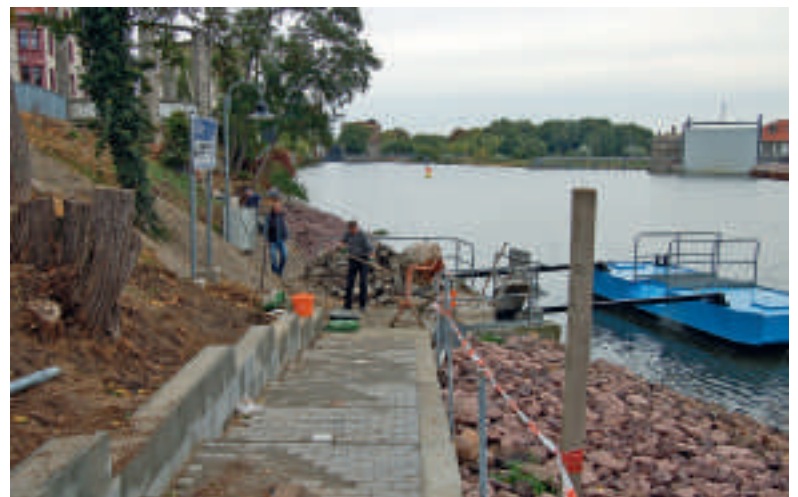
Die Arbeiten des Verschönerungsvereins nehmen langsam Gestalt an.

war, freigelegt werden sollen. Das Ufer wurde, nach Absenkung des Wasserspiegels in Absprache mit dem Buchtenkraftwerk, mit einer Steinschüttung versehen. Sie soll das weitere Abrutschen der Erdmassen in die Saale verhindern. Und nun zeigt sich die große Unterstützung, die diesem Verein geleistet wird. Die Steinschüttung, die alleine 180.000 € gekostet hätte, wurde vom Wasser- und Schifffahrtsamt übernommen, denn es standen nur 9.000 € an eigenen Mitteln zur Verfügung. Eine große Resonanz bei der Realisierung der anstehenden Arbeiten kam von Betrieben aus Calbe. Es wurden Erd- und Schalungsmaßnahmen durchgeführt. Zu nennen sind da Naumann & Partner, Demele Holz und Dachbau und Mitarbeiter des Baubetriebshofes. Die Brücke zum Schiffsanleger wies erhebliche Schäden auf. Sie wird von der Firma Doppstadt neu erstellt und anschließend verzinkt. Die Treppe zum Schiffsanleger