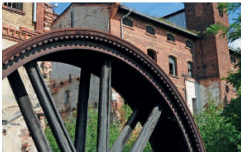
Das gewaltige Schwungrad.

Die Verschraubung an der Innenseite lässt den Schluss zu, dass dieses Seilscheibenschwungrad aus zwei Gussteilen zusammengefügt wurde. Schwer vorstellbar – aber in jener Zeit schon machbar, die dann notwendige präzise Metallbearbeitung bei diesem Durchmesser und dem Gewicht. Die seitlich erkennbare