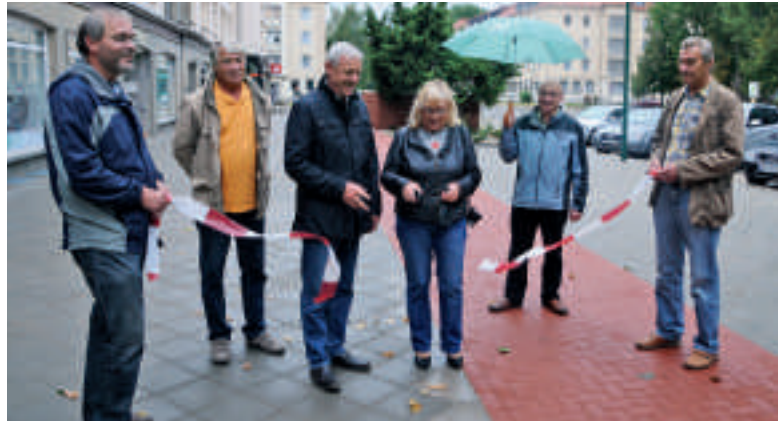
Symbolischer Schnitt zur Einweihung des Lessingstraßenbereiches.

Calbe. Nach einem Grundstückstausch mit der Stadt hat die Calbener Wohnungsbaugenossenschaft (CWG) rund 150 000 Euro in die Neugestaltung der Ladenzeile in der Lessingstraße investiert. Das Formensammelsorium alter Gehwegplatten, die sich in den vergangenen Jahren langsam auflösten, wurde durch neue Betonplatten und rotes Kunststeinpflaster für den Radweg ersetzt. Letzterer hebt sich jetzt gut von den breiten Gehwegbereichen ab.