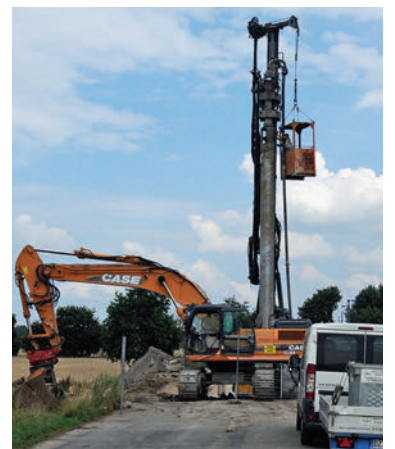
Im Dezember soll die Taubebrücke fertig sein.

und das Rohr mit Ort beton verfüllt. Entsprechend des Betonierfortschrittes zieht man das Stahlrohr schrittweise heraus, wobei auch eindringendes Wasser vom frischem Beton nach oben gedrückt wird. Ort betonpfähle werden für statisch anspruchsvolle Gründungen verwendet. Dazu gehört das Umfeld der Taube. Wie die zuständige Landesstraßenmeisterei mitteilte, sei die Befahrbarkeit des neuen Brückenbauwerks für Anfang Dezember geplant. ■