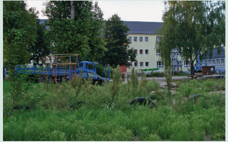
Eine spannende Frage: Wie wird das Gelände hinter der Lessingschule zum Schulanfang aussehen?