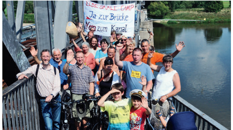
Teilnehmer des Elbe-Saale-Camp auf der Barbyer Elbbrücke.