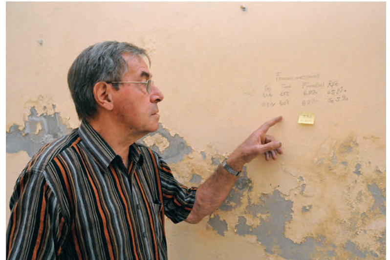
Im Inneren des Kuppelraumes im Turmfuß löst sich die Farbe. Feuchtigkeitsbedingte Salze werden die Ursache sein.

sein schlummernde Kuppelraum wieder erweckt. Damals organisierte und gestaltete Rudi Kramer eine Ausstellung mit 13 Schautafeln. Es wurden Dinge gezeigt, die im unmittelbaren Zusammenhang mit dem Wartenberg stehen: Geografie und Geomorphologie (Oberflächenform), Flora und Fauna, Geschichte von Turm und Namensgeber, einheimische Wildkräuter. Die Tafeln wurden während des 2013er Hochwassers