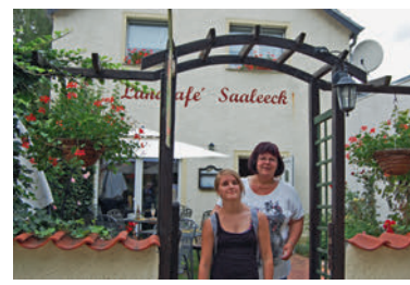
„Landcafé Saaleck“, Tippelskirchen.

Auch die Gaststätte „Grüne Lunge“, Am Schlossanger 1, macht ihrem Namen Ehre. Bei einem Spontanbesuch des „Calbenser Blatt“ standen mitten in der