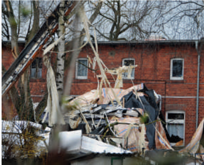
So sah es hinter einem Ziegelbau im Damaschkeplan aus. Das komplette Dach war aus der Verankerung gerissen worden.

Der Ziegelbau war einst Wohnhaus für Angestellte des Gutes „Bartels Hof“. Bis vor Jahren wurde er von einem davor stehenden Ziegelblock geschützt, der abgerissen wurde. Seitdem trifft die