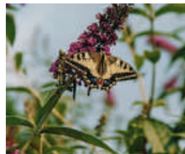
Schwalbenschwanz (Papilio machadn), 3. Generation an Sommerflieder (Bubbleja Davidii)

Calbe. Diese wunderschön kräftig schwarzgelb gezeichnete Falterart erscheint nach dem Beginn der Sommerzeit etwa ab Mitte April in wenigen Exemplaren in unserer Landschaft. Die Faltergröße bewegt sich zwischen 30 bis 43 mm Flügelspanne. Die Namensgebung des Schwalbenschwanz basiert auf die schwanzähnliche Ausziehung seiner Hinterflügel.