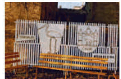
Der Storchplatz in den 80ern.

Zum Schluss der Veranstaltung wurde mit Blick in Richtung Stadt und der Diskussion um die zukünftige Auslagerung der alten Zeitungen in entfernte Archive darauf hingewiesen, dass dann bewährte Archivarbeit in Gefahr