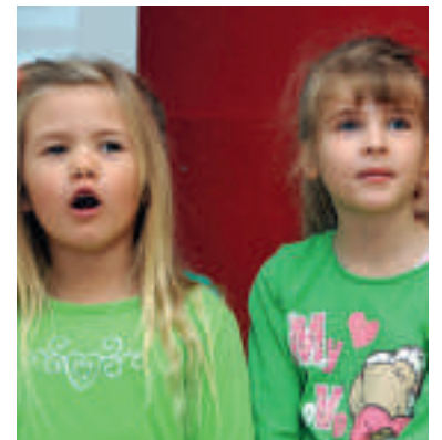
Die Jüngsten führten ein Programm auf.

waren viele Bürgerspendsen enthalten. Auch verkaufte man Ansichtskarten mit dem Motiv des Neubaus für eine DDR-Mark. Um Baufreiheit zu erlangen, wurde eine alte Turnhalle am Schweinemarkt abgerissen. Noch wenige Jahre zuvor waren darin Kriegsgefangene interniert. Weil Baustoffe knapp waren, wurden Steine der gesprengten Saalebrücke und des ehemaligen Schlosses abgeputzt. In Zeiten des Wohnraum Mangels und tausender Hei-