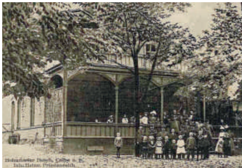
Buschschützen mit Familien um 1900 im Hohendorfer Busch.

Der Sohn des Kurfürsten – 1701 zum „König in Preußen“ gekrönt – war da schon aufgeschlossener. Friedrich I., der das luxuriöse Leben liebte und bei seinen Zeitgenossen als gutherzig und lebensfroh galt, war öfters im Schloss Calbe zu Gast gewesen und hatte das „Cälberei“-Bier so sehr in sein Herz geschlossen, dass er sich mehrere Fässer davon nach Berlin schicken ließ. Da war es keine Frage, dass der huldvolle Fürst schon 1693, also noch bevor er König wurde, den Bürgern von Calbe die Gründung einer Schützengesellschaft (25. Mai 1694) und den stattlichen Betrag von 30 Talern aus der Akzise-Kasse bewilligte, der je zur Hälfte für den Bau einer Schießstrecke mit Baracke im Stadtgraben neben dem Brumbyer Tor und für die Anschaffung von Preisen verwendet wurde. Friedrich schenkte der Schützengilde zu Calbe sogar zwei weiß-blaue Fahnen, die in der folgenden Zeit die ursprünglichen weiß-roten Fahnen der Bürgerschaft und der Stadt ablösten. Von Ende Juni bis Ende September fanden im Schießgraben montags ab 13 Uhr die Preisschießen statt. Es ist in diesem Zusammenhang interessant, dass selbst im arbeitsbeflissenen Preußen anfänglich noch der jahrhundertalte „Blaue Montag“ (teilweise arbeitsfreier Montag) galt. 1701 wurde die Baracke im Schützengraben durch ein festes Schützenhaus ersetzt. Nach dem Tod Fried-