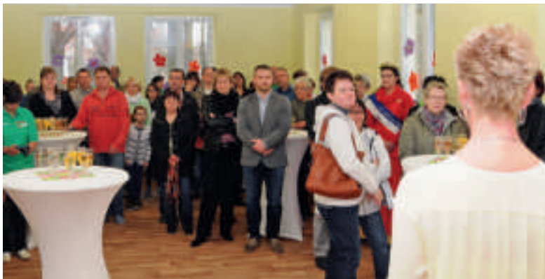
Mangel an Besuchern herrschte zur Wiedereinweihung der Kita nicht.