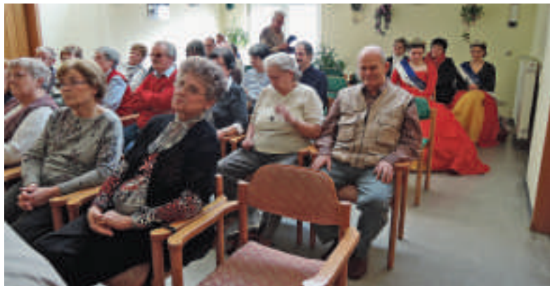
Neben Gästen sind auch viele Mitglieder des Behindertenverbandes Calbe (BVC) zur Festveranstaltung gekommen.

ständig. Schnell erreichte der Behindertenverband Calbe eine Anzahl von 100 Mitgliedern, was man so ganz nebenbei bei einer Busfahrt in den Harz feststellte. Eine Dampferfahrt auf der Elbe, eine Fernsehreportage mit dem MDR, Fahrten in den Spreewald und eine Berlinfahrt mit einem Besuch einer Fernsehaufzeichnung des Glücksrades sind noch vielen in Erinnerung. Inzwischen ist die Mitgliederzahl zwar geschrumpft, aber gesellige Zusam-