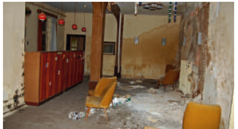
Blick in die ehemalige Gaststätte Loeweclub.