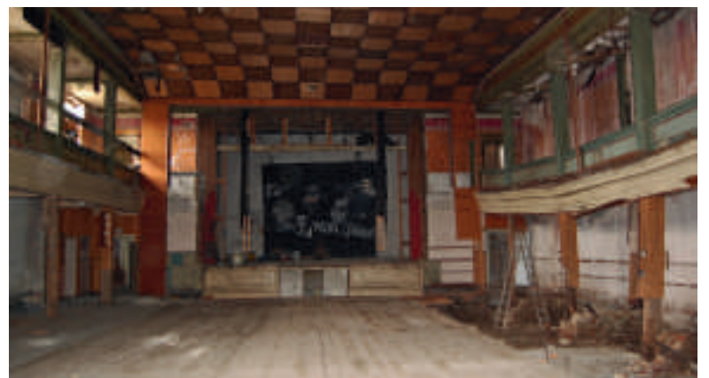
Der ehemalige Kinosaal - ein Trauerspiel.

Heute befindet sich das Gebäude in einem miserablen Zustand, eigentlich schade. ■