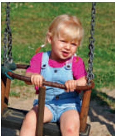
Kinderschaukel in der Jahnstraße mit leichtem Reparaturbedarf.

Calbe. Wer regelmäßig mit seinen Kindern bzw. Enkelkindern auf den Spielplätzen im Stadtgebiet unterwegs ist, kennt die Problematik. Unseren lieben Kleinen ist es eigentlich egal, in welchem Zustand sich das jeweilige Spielgerät befindet, ob alt oder neu. Warum erwähne ich das? Die erfolgreiche Bewerbung unserer Stadt bei einem Wettbewerb eines großen Getränkeherstellers wird wohl zu einer neuen Rutsche führen. Prima! Doch wenn ich höre, dass dafür die alte und bewährte Rutsche in der „Grünen Lunge“ abgebaut werden soll, dann finde ich das nicht so toll. Diese tut doch noch ihren Dienst. Warum kauft man nicht ein anderes Gerät oder setzt die neue Rutsche