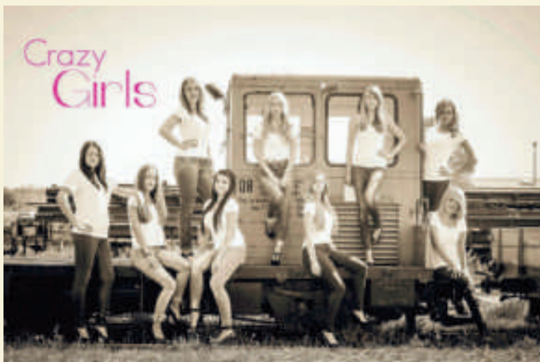
Showtanz Crazy Girls