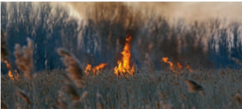
Mehrfach brannte es in diesem Jahr an den Grizehner Teichen.