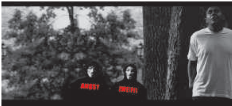
Szene aus dem Musikvideo „Sin City“, das auf YouTube läuft.