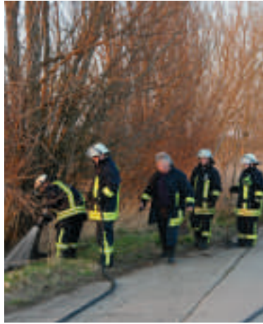
Die Calbenser Wehr löscht am Weg.

Die Grizehner Teiche haben einen ausgedehnten Röhrichtbestand mit Schilfinseln. Sie gelten als wertvolles Biotop mit seltenen Amphibienarten. ■