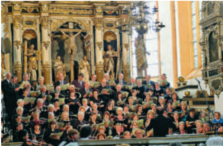
Die Aufführung von Händels „Messias“ in der Johanniskirche in Bad Salzelmen zeigt die Fülle der Sänger und Sängerinnen der Schönebecker Kantorei.