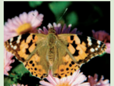
Distelfalter auf Herbstasternblüten in Calbe/Saale.

Calbe. Der Distelfalter gehört zu den bekanntesten Vertretern der Wanderfalter und ist außer in Südamerika weltweit verbreitet. Die jährliche Einwanderung erfolgt aus dem nordafrikanischen Raum in Richtung Skandinavien und erreicht unsere Region in der mitteleuropäischen Landschaft ab Mitte Mai mit einem Flugmaximum im Monat Juni. Der Distelfalter ist ein drangvoller, ungestümer Flieger mit einem großen Aktionsradius und bevorzugt in seinen zwei Generationen offene und halboffene, blumenreiche Biotope zur Nektaraufnahme und Vermehrung. Dabei ist die Falterzahl erheblichen jährlichen Schwankungen unterworfen. Die Nachkommen des Distelfalters fliegen größtenteils über das Alpenmassiv im Spätsommer bis zum Herbst in ihre afrikanische Ursprungsheimat zurück. Die Art wandert dann manchmal in tagelangen Schwärmen oder als zielgerichteter Einzelfalter. Überwinterungsversuche sind bekannt geworden, aber aufgrund unseres wechselhaften Winterklimas zurzeit zum Scheitern verurteilt. Zur Nektaraufnahme werden die verschiedensten Distel- und Klettenarten, der Sommerflieder sowie blühende Herbstastern bevorzugt aufgesucht. Die Nahrungsgrundlage der Raupen bezieht sich auf Distelarten, Brennesstauden, Beifuß, Kletten, Schafgarbe und viele andere Pflanzenarten. Die Raupe ist