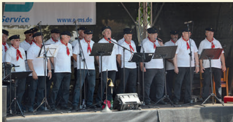
Shanty Chor Schönebeck