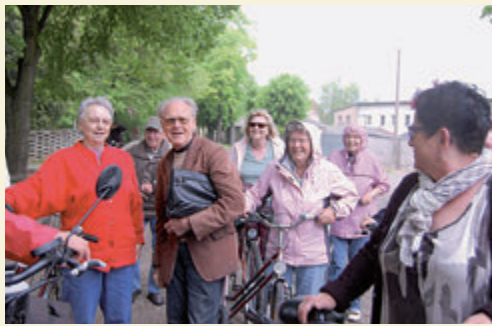
Täve wie er lebt und lebt

gesamte Ablauf fiel sprichwörtlich ins Wasser. An den Ständen drängten sich die Leute unter die Planen und Schirme, auf der kleinen Bühne stellte Horst Schäfer die Ehrengäste vor, doch so richtiges Feeling kam nicht auf. Wer pfiffig war, stattet dem Radsportmuseum einen Besuch ab, dort hatten sich mittlerweile die Spitzensportler von damals eingefunden. Trotz des feuchten Wetters, wofür niemand was kann, muss man dem Veranstalter und allen Helfern Dank sagen! ☐