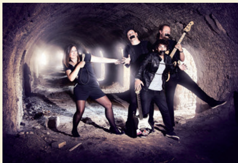
Band Ventura Fox