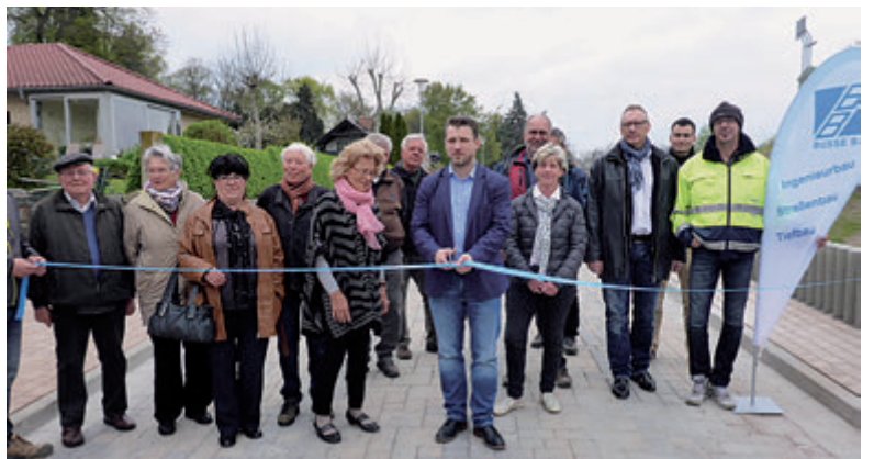
Freigabe der Straße „An der Saale“.

Calbe. Rund eine halbe Million Euro Fördermittel flossen in die grundhafte Sanierung des knapp 200 Meter langen kommunalen Straßenabschnittes „An der Saale“. Mitte April wurde die Straße eingeweiht. Im Beisein von Vertretern des Abwasserzweckverbandes (AZV), der Stadt und einigen Anwohnern fand die 38. Hochwassermaßnahme damit ihren Abschluss. „Rund 485 000 Euro Fördermittel haben Stadt und AZV für diese Maßnahmen beantragt und genehmigt bekommen“, sagte Bürgermeis-