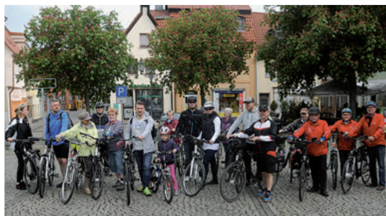
An der Sternfahrt nach Aken beteiligten sich 21 Calbenser.

Kinder lernen in „Fienchens Fragekiste“ zum Beispiel, wo die Erdbeeren ihre Samen haben oder warum Pinguine nicht fliegen können. Und auch, welches das größte Organ des Menschen ist. Antworten, bei denen wohl auch Erwachsene so ihre Schwierigkeiten hätten. Also bitte Seite 16 nicht überlesen. □