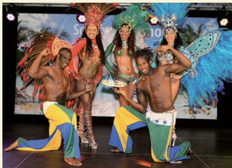
Brasilianische Tanz- und Animationsshow