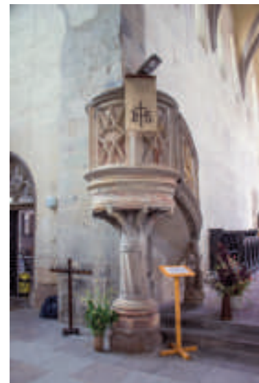
Sandsteinkanzel von Urban Hachenberg 1561.

Inzwischen hatte der Wettbewerb der Konfessionen dem christlichen Reich einen erheblichen Aufschwung beschert. Die größten wirtschaftlichen und sozialen Fortschritte erzielte die am meisten gemäßigte protestantische Konfession, deren Vertreter man nach ihrem Begründer Jean Calvin die „Kalvinisten“ oder die „Reformierten“ nannte. Der rasante Aufschwung in Europa ließ die herrschenden Fürsten immer heftiger nach einer gewaltsamen Veränderung der konfessionellen Landkarte drängen. Auch die wirtschaftlich gestärkten Städte begehrteten auf. Im Besitz der Heimatstube Calbe befindet sich eine Pergamenturkunde von 1611, in der die Stadt neue kommunale Freiheiten und