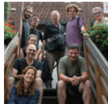
Die Filmcrew vor der Heimatstube.