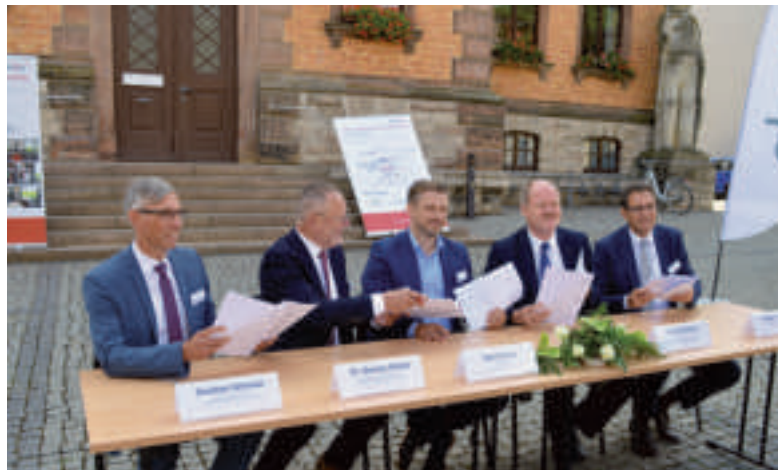
Der Vertrag wurde auf dem Marktplatz unterzeichnet.

Die durchgehende Verbindung gibt es seit Dezember 2013. Sie wird derzeit von DB Regio und ab Dezember 2018 von Abellio betrieben. Das Land zahlt für die ungefähr 250000