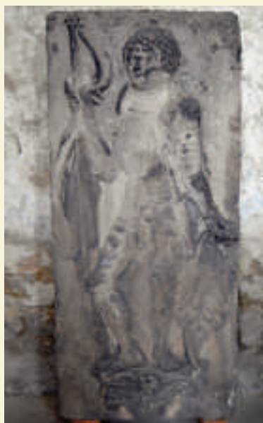
Eine der beiden Relieftafeln als Leihgabe für das Museum.

Die alte Handelsstadt und Erzbischofszweitresidenz Calbe an der Saale wirkte in der Ausgangsphase der lutherischen Reformation als „Rad im Getriebe“ des geist-