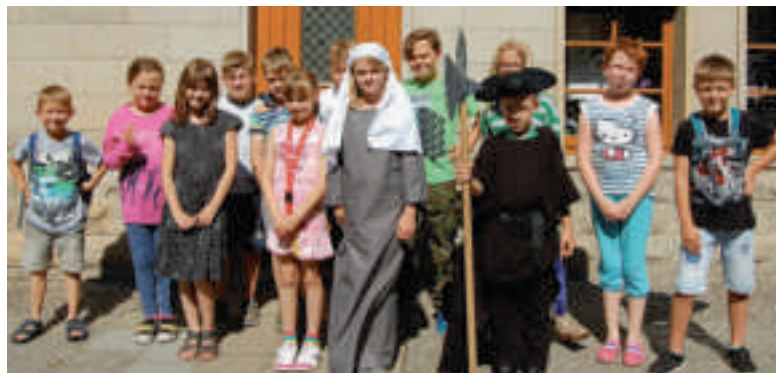
Gruppenaufnahme mit Nachtwächter und Begine.

in Calbe in der Vergangenheit. So ist ein Film von Kindern für Kinder, aber auch für Erwachsene entstanden. Das Ganze ist ein Gemeinschaftsprojekt zwischen Heimatverein Calbe und dem Lessinghort. Bekanntlich hatte sich der Heimatverein mit der Projektidee des Filmes im Dezember bei der EMS beworben und einen Preis in Form einer finanziellen Unterstützung erhalten. Diese Finanzen kamen nun für den Film zum Einsatz. Zum Bollenfest ist es dann möglich, diesen Streifen zu sehen, da er an beiden Tagen in der Heimatstube aufgeführt wird, siehe Information des Heimatvereins. Allen kleinen Schauspielern und großen Helfern sei an dieser Stelle noch einmal ausdrücklich gedankt. Es hat allen Beteiligten Spaß bereitet. ■