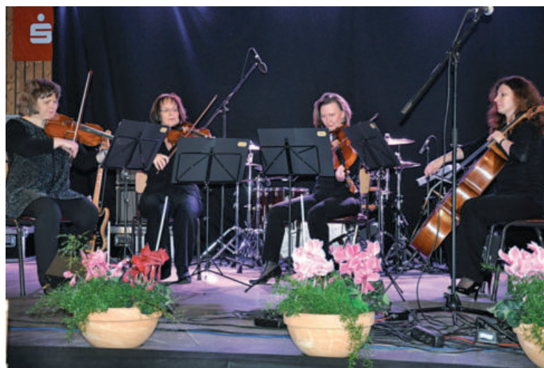
Die vier Musikerinnen vom Streichquartett der Mitteldeutschen Kammerphilharmonie Schönebeck sorgten zu Eröffnung für eine festliche Note.