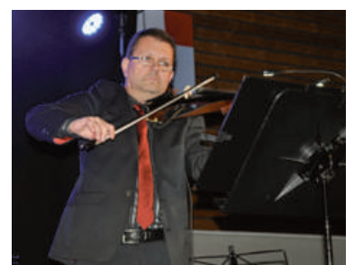
Ungewohnte Geigenklänge in der Herdersporthalle.