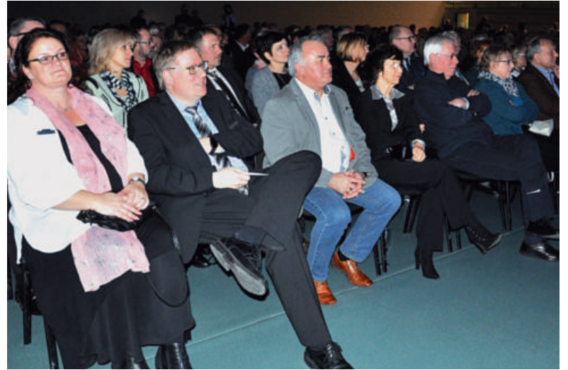
Zum Neujahrsempfang waren rund 300 Besucher in die Calbenser Hegersporthalle gekommen.