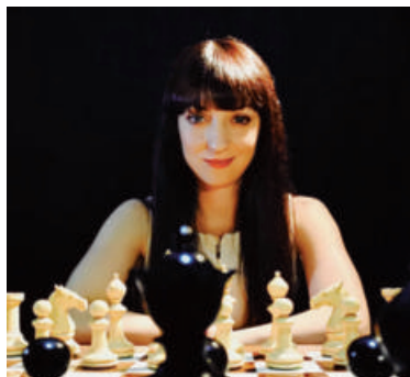
Großmeisterin Elisabeth Pähtz.

Calbe. Begeisterung bei den Schachspielen. Zum 90-jährigen Gründungstag ist es der Abteilung Schach gelungen, die mehrfache Deutsche Meisterin (Jugend- und Juniorenweltmeisterin, Vize-Schnellschacheuropameisterin, seit 1998 Spitzenspielerin der Deutschen Nationalmannschaft, 3. Platz Rapid-Weltmeisterschaft) und frischgekörtete Weltmeisterschaftsdritte 2017 im Schnellschach – einfach die beste deutsche Schachspielerin, Elisabeth Pähtz, für eine Simultanveranstaltung am 10.03.2018 um 10.00 Uhr in der Aula des Schillergymnasiums zu gewinnen.