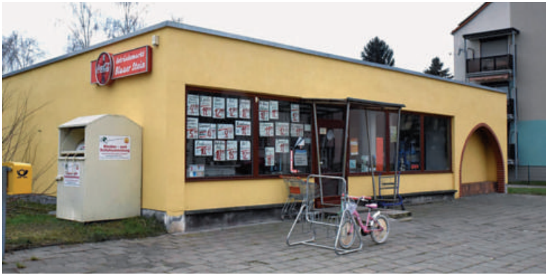
Am 7. März soll hier in Barby eine Postfiliale eröffnen.