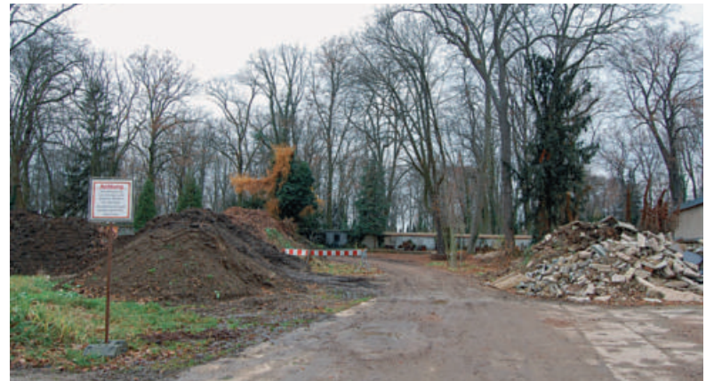
Deponieartiger Gesamteindruck beim neuen Besucherparkplatz.

Seit vielen Jahren gibt es von Seiten der Stadtverwaltung Bemühungen, unseren städtischen Friedhof durch neue Konzepte und Ideen den neuen, sich verändernden Rahmenbedingungen wie Bestattungskultur, Größenverhältnisse und moderate Gebühren anzupassen. Diese Aktivitäten sind durchaus positiv zu betrachten, spielen jedoch bei unseren Überlegungen und Vorschlägen eine nebensächliche Rolle. Uns geht es mehr darum, verbesserungswürdige Ist-Zustände, die