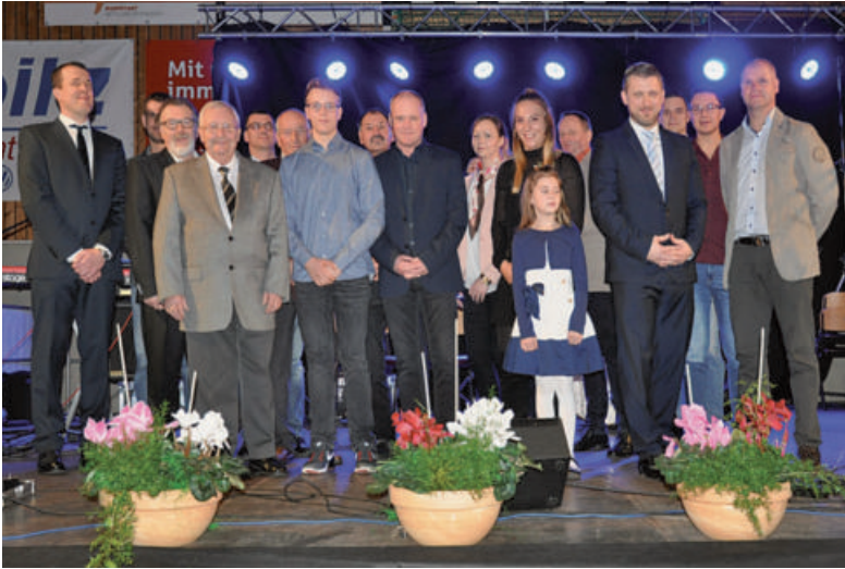
Alle von der Stadt und der TSG Ausgezeichneten des Neujahrsempfangs auf der Bühne.