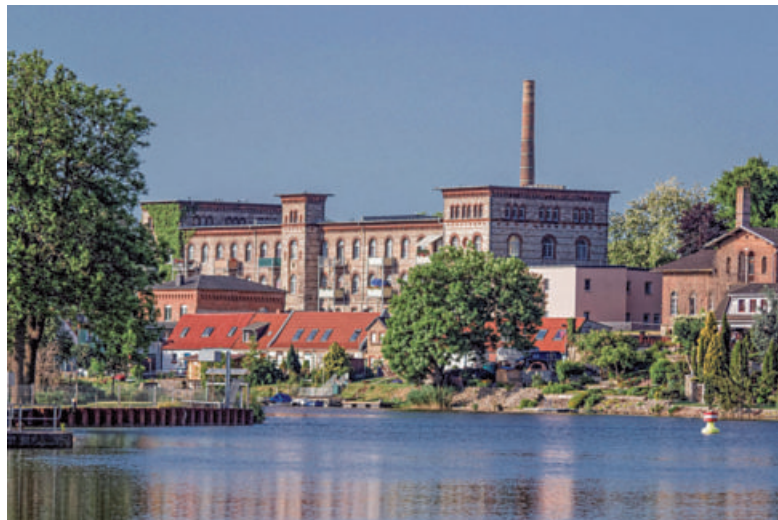
Ehemalige Nicolai-Tuchfabrik in Calbe, jetzt AWO Wohnanlage.

Seine Urenkel Alexander und Adolph konnten 1851 schon das große Fabrikgebäude wegen des großen Wasser- und Kohlebedarfs der neuen Dampfmaschinen direkt über dem Saalebogen errichten lassen. Der sozial denkende Demokrat Alexander Nicolai wurde im Mai 1848 als stellvertretender Abgeordneter