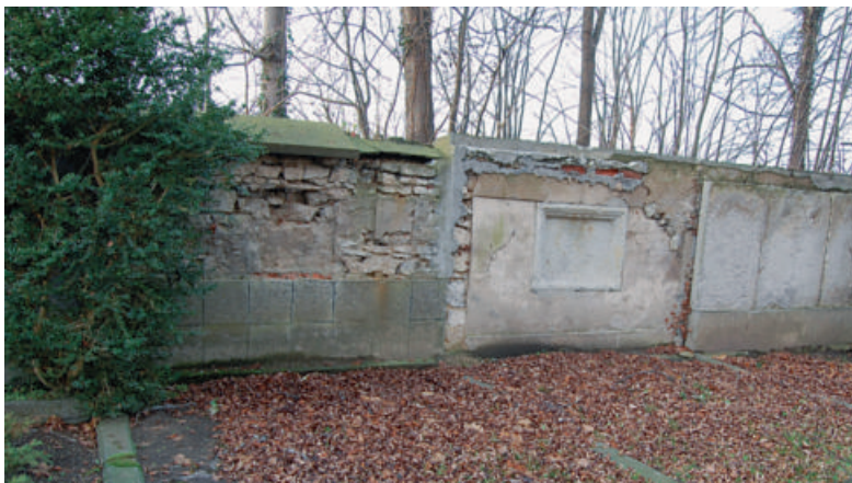
Beispiel für sanierungsbedürftige Mauergräber.

optisch in relativ häufiger Anzahl vorhanden sind, aufzuzeigen. Konkret unterteilen wir in 1. Historische Grabmale, 2. Allgemeiner Pflegezustand auf allen drei Teilbereichen, 3. Friedhofskapelle und 4. bedeutende Einzeldenkmale. Bei den Historischen Grabanlagen handelt es sich um historisch wertvolle Grabanlagen, die vom Normalbürger bis hin zu namhaften Persönlichkeiten reichen und unbedingt zu erhalten sind. In diese Kategorie fallen auch die zahlreichen Wandbegräbnisstätten, die maßgeblich den Gesamt-